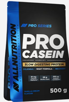
ALLNUTRITION Pro Casein