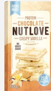
NUTLOVE Protein Chocolate Crispy Vanilla with Biscuits