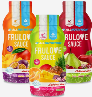
ALLNUTRITION FruLove Sauce