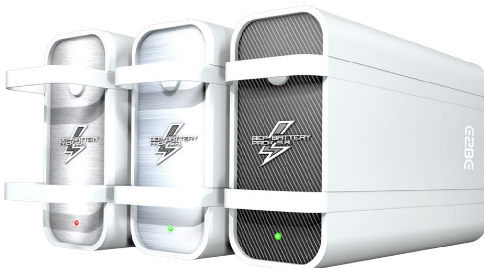
Źródło własne - Biomass Energy Project S.A. Baterie litowe