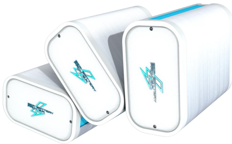
Źródło własne - Biomass Energy Project S.A. Systemy baterii litowych