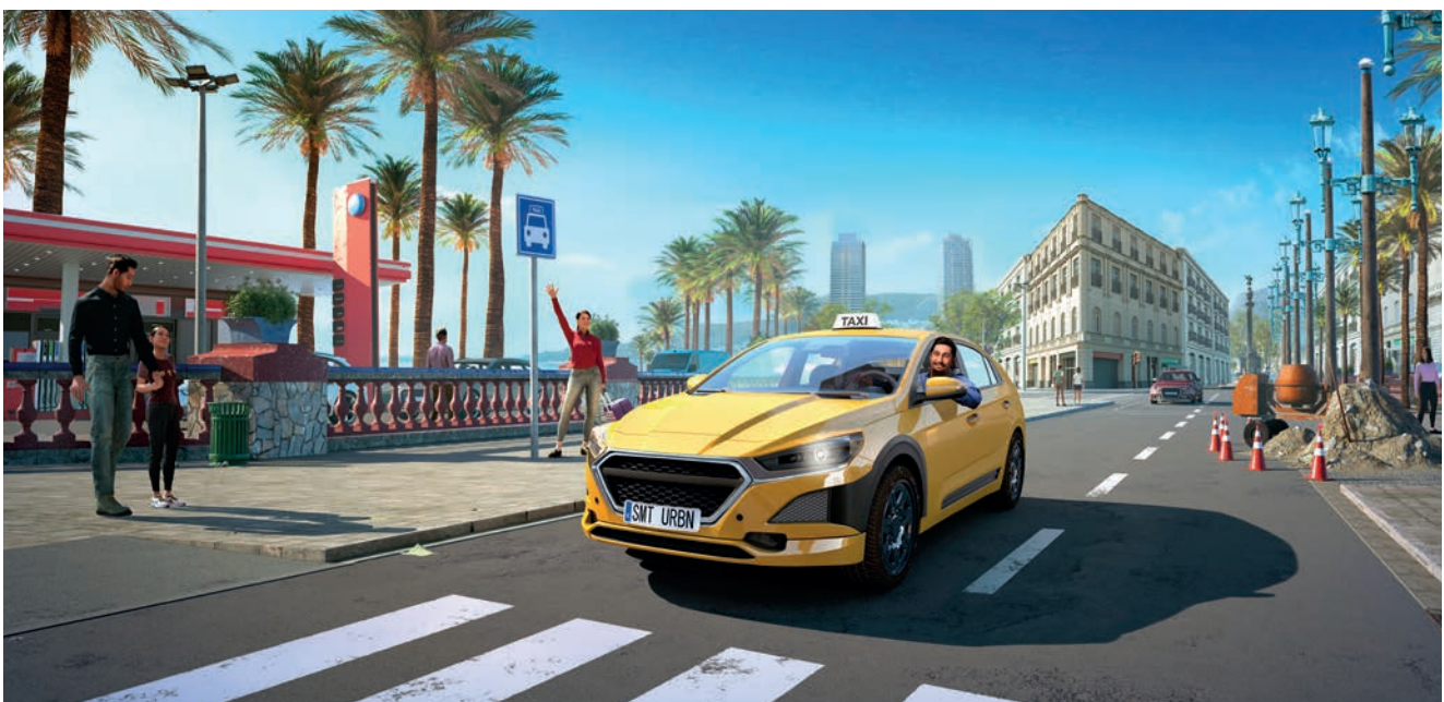
Grafika promocyjna Taxi Life

12.07.2022 Zarząd Spółki poinformował, że zawarł umowę ze spółką Nacon SAS („NACON”) dotyczącą wydania gry Taxi Life .