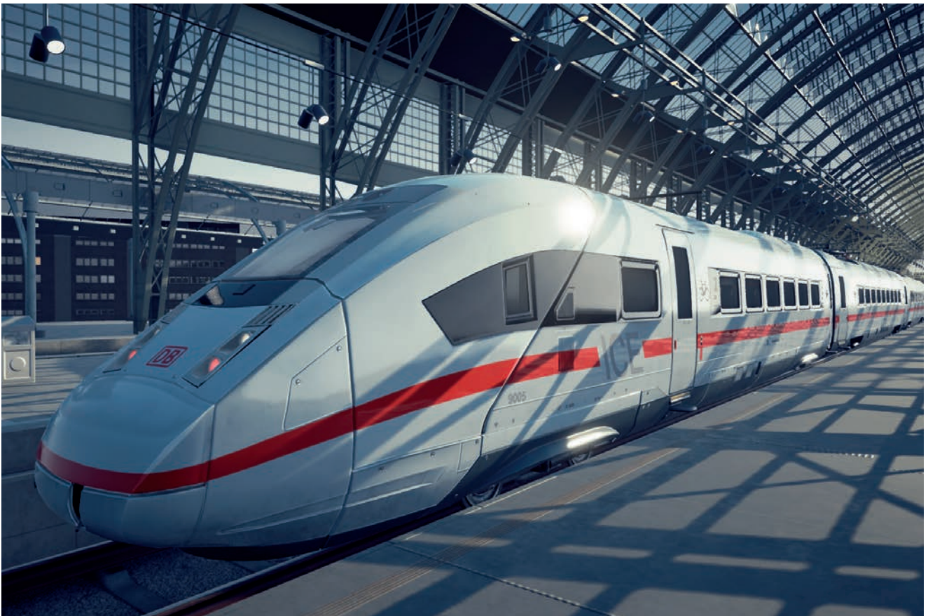
Grafika promocyjna Train Life: A Railway Simulator

Zarząd Spółki Simteract S.A. z siedzibą w Krakowie („Emitent”) informuje, że wraz z NACON, wydawcą gry, ustalił datę wydania gry Train Life: A Railway Simulator na konsolę Nintendo Switch na 9 marca 2023 roku.