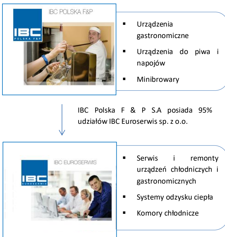
Tabela: Wykaz jednostek wchodzących w skład Grupy Kapitałowej IBC POLSKA F & P S.A.