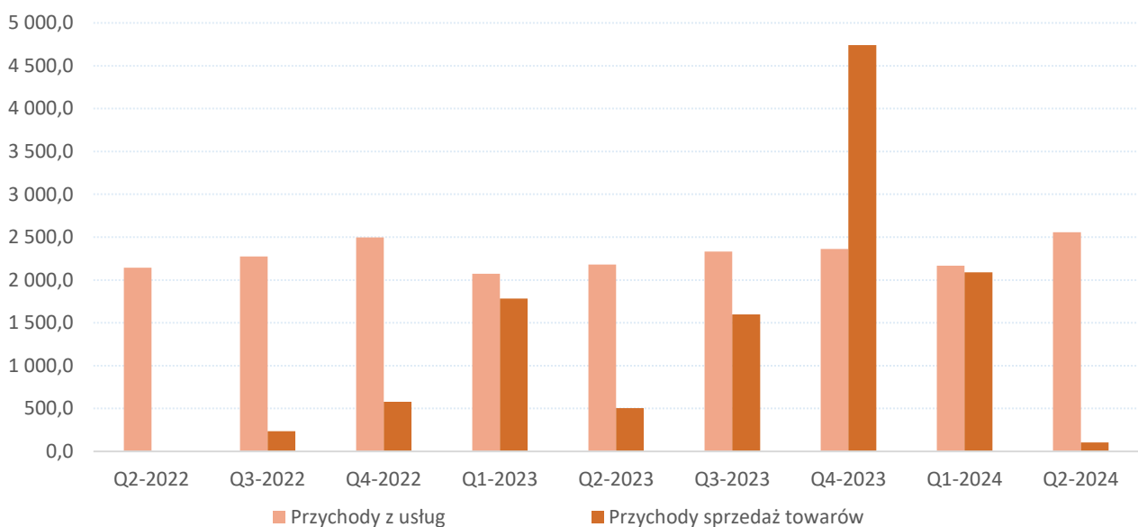
Przychody 4Mobility S.A. w tys. zł

W pierwszym kwartale 2024 r. Spółka pozyskała ponad 2600 nowych użytkowników i osiągnęła poziom 113.300 zarejestrowanych użytkowników na 30 czerwca 2024 r.