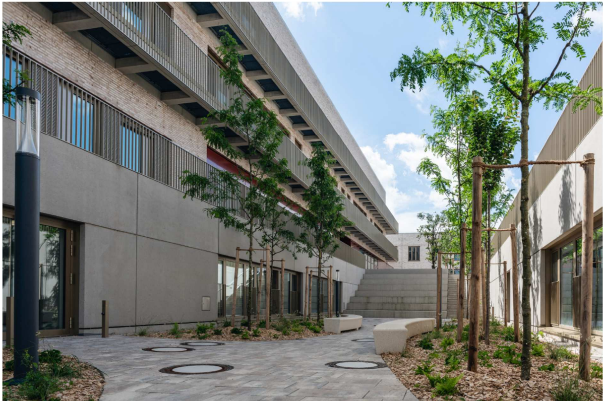
Otto Heil, szkoła w Monahium