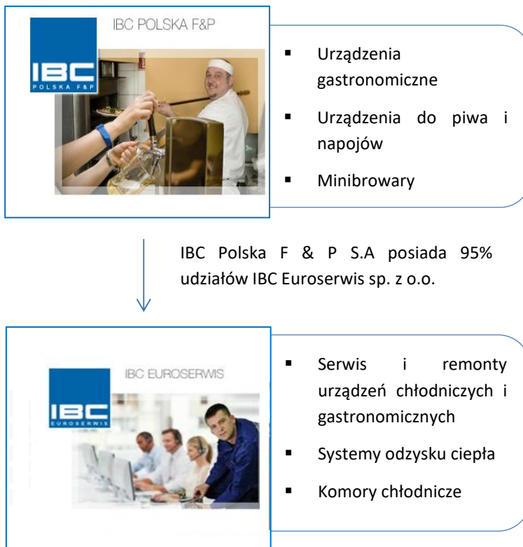
Tabela: Wykaz jednostek wchodzących w skład Grupy Kapitałowej IBC POLSKA F & P S.A.