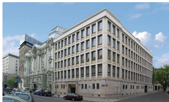
Oddział WASKO S.A. Warszawa, ul. Czackiego

Posiadamy m.in. certyfikat ISO 9001, ISO 14001, ISO 27001. Nasze kompetencje umożliwiają realizację ogólnopolskich systemów mających na celu poprawę bezpieczeństwa i obronności kraju.